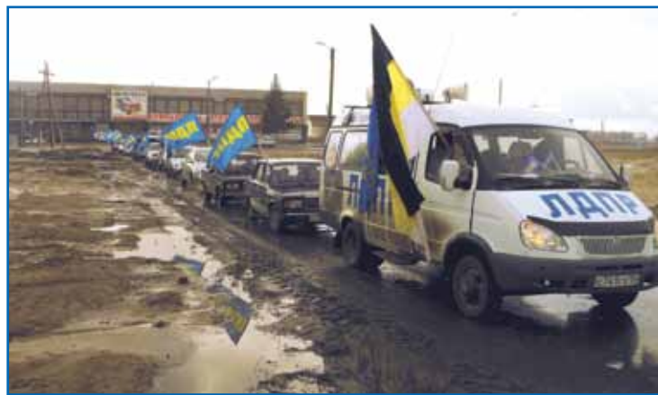
Автопробегом по бездорожью ударили активисты ЛДПР в апреле.

здесь ЛДПР встретила только положительную реакцию. Омрачило настроение партийцев только одно обстоятельство: растаял снег, а с ним – асфальт. Координаторы местных отделений ЛДПР уже готовят за-