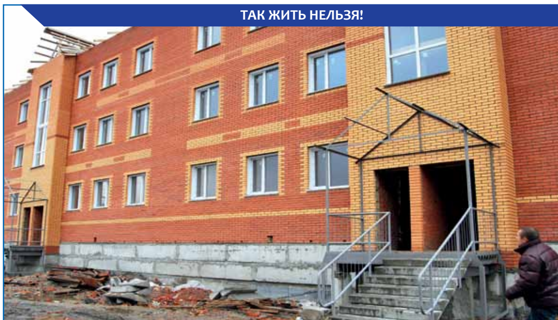
ТАК ЖИТЬ НЕЛЬЗЯ!

В этом году на расселение жителей ветхих домов в Новосибирской области из бюджетов разных уровней было направлено почти два миллиарда рублей. Согласитесь, сумма немалая даже в масштабах страны, не говоря уже об области. А программа не работает и всё больше становится похожей на кладбище бюджетных миллионов. У контролирующих органов есть все основания привлечь к ответственности местных чиновников, которые не уделяют должного внимания качеству строящегося по федеральной программе жилья. И сделать это необходимо как можно скорее. А то как бы мы не пришли к тому, что переселять людей придется каждые пять лет.