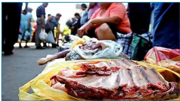
НОВОСИБИРСКИЕ ЧИНОВНИКИ НЕ МОГУТ СПРАВИТЬСЯ С ТОРГОВЦАМИ С ХИЛОКСКОГО РЫНКА, КОТОРЫЕ ПРОДАЮТ МЯСО ПОД ОКНАМИ ЖИЛЫХ ДОМОВ, НАРУШАЯ ВСЕ САНИТАРНЫЕ НОРМЫ.

Рынок на улице Хилокской доставляет много хлопот жителям Ленинского района. С раннего утра до позднего вечера тут стоит шум и гам, бесконечно подъезжают автомобили, в воздухе висит запах выхлопных газов, гнилых овощей и фруктов. Торговцы – а это преимущественно выходцы из Средней Азии – живут по